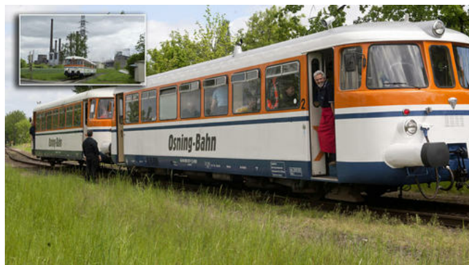
Hielt auf dem Ilseder Hüttengelände: Der Stahlstad-Express.

Ilsede. Auf den Gleisen der Stahlgeschichte waren jetzt etwa 150 Menschen aus Peine und der umliegenden Industrie-Region unterwegs. Der „Stahlstadexpress“ machte auch in Ilsede halt, wo Manfred Vorberg übers Hüttengelände führte.